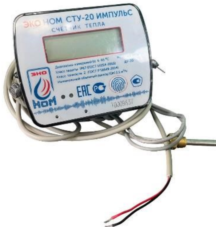
а) вычислитель с термопреобразователями сопротивления

Теплосчетчики имеют исполнения ЭКО НОМ СТУ-15.1, ЭКО НОМ СТУ-15.2, ЭКО НОМ СТУ-20, отличающиеся диапазоном расхода и номинальным диаметром. Общий вид теплосчетчиков приведен на рисунке 1.