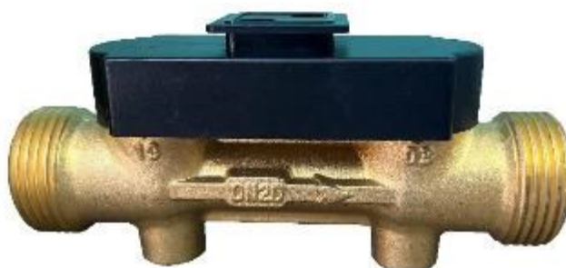
б) первичный преобразователь расхода