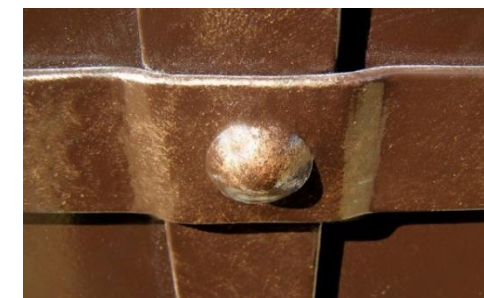
Антивандажные крепления конструкций

♦ Длина болта указывается до шляпки, вместе с квадратным подголовником