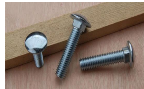
Соединение деталей при сборке мебели