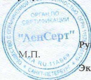
Схема сертификации 1с