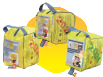
Стандартная сумка со светоотражающими элементами для хранения и переноски