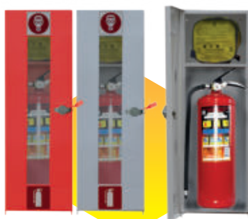
Контейнер ОП-4 «Шанс» для хранения средств защиты и спасения марки «Шанс» и огнетушителя