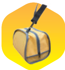
Сумка - футляр «Шанс» износостойкая, для постоянного ношения на пожароопасных объектах