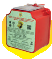
Футляр - контейнер «Шанс» светится в темноте до 30 мин., крепится на стену