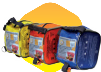
Сумки в корпоративных цветах