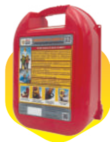
Ударопрочный футляр универсальный под пожарно-спасательны е комплекты