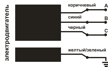
Рис. 4 Принципиальная электрическая схема