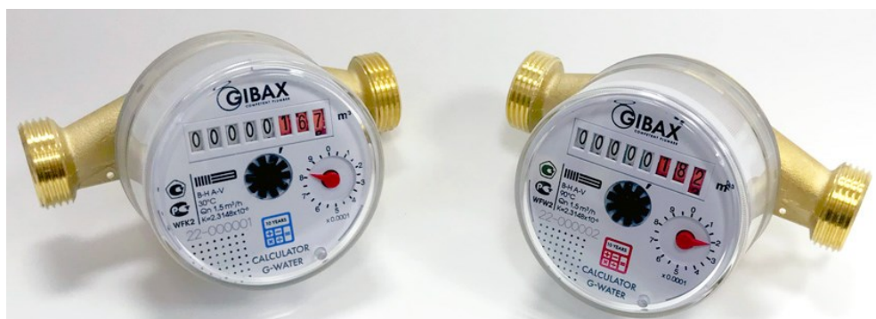
Рисунок 6 - Внешний вид счетчиков с изображением товарного знака GIBAX