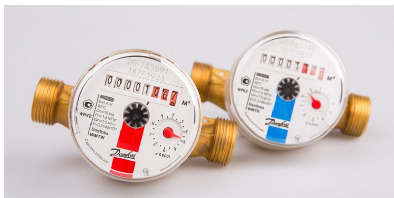
Рисунок 4 - Внешний вид счетчиков с изображением товарного знака Danfoss