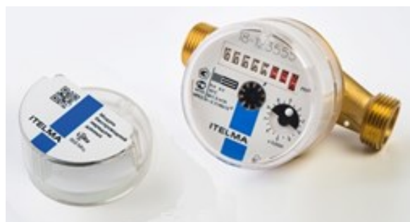
Рисунок 3 - Внешний вид счетчиков с модулем электронного считывания