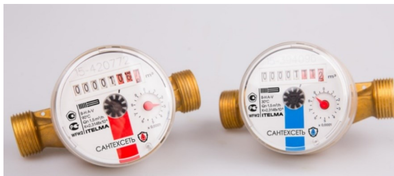
Рисунок 5 - Внешний вид счетчиков с изображением товарного знака САНТЕХСЕТЬ