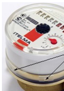
Рисунок 1 - Внешний вид и места пломбирования счетчиков