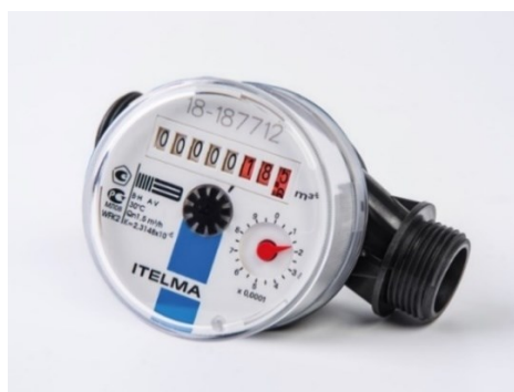
Рисунок 8 - Внешний вид счетчиков в пластиковом корпусе