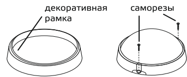
Рис. 1. Установка светильника