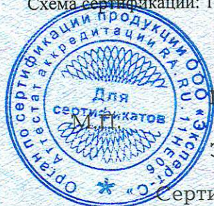
Схема сертификации: Ic