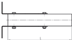
Габаритный чертёж SPP-AC2