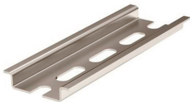
Рисунок 1. Внешний вид рейки DR-p