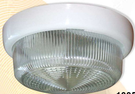
1005500564 "Раунд" 200 НБО 23-60-001 IP44 корпус белый ГУ

Светильник "Раунд" отличается удобством монтажа и обслуживания. Рассеиватель светильника крепится присоединением "байонет". Рассеиватель имеет специальные выступы, позволяющие легко снимать его, повернув против часовой стрелки и открыв тем самым доступ к лампе. Пластиковый корпус позволяет повысить влагостойкость светильника, облегчить его вес. Светильники монтируются непосредственно на стену или потолок. Степень защиты IP 44. В светильниках установлены керамические патроны с цоколем Е 27, применяются светодиодные лампы, лампы накаливания ЛОН.