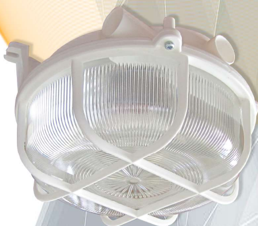
1005500877 "Креа" Круг НПП 03-100-007 IP44 корпус с решеткой белый ГИ

Пылевлагозащита IP44. Керамический патрон E27 позволяет использовать светодиодную лампу или накаливания до 100вт.