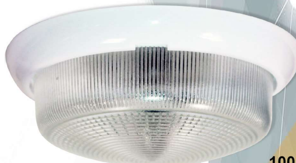
1005500569 "Раунд" 240 НБО 23-100-001 IP44 корпус белый ГУ