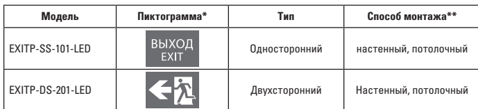
Таблица 3. Модификации светильников

* Для светильников EXIT-SS-100-LED и EXIT-DS-200-LED пиктограмма приобретается отдельно. Для остальных светильников пиктограмма идет в комплекте и ее замена невозможна!